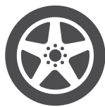
חישוקי 20 אינץ'