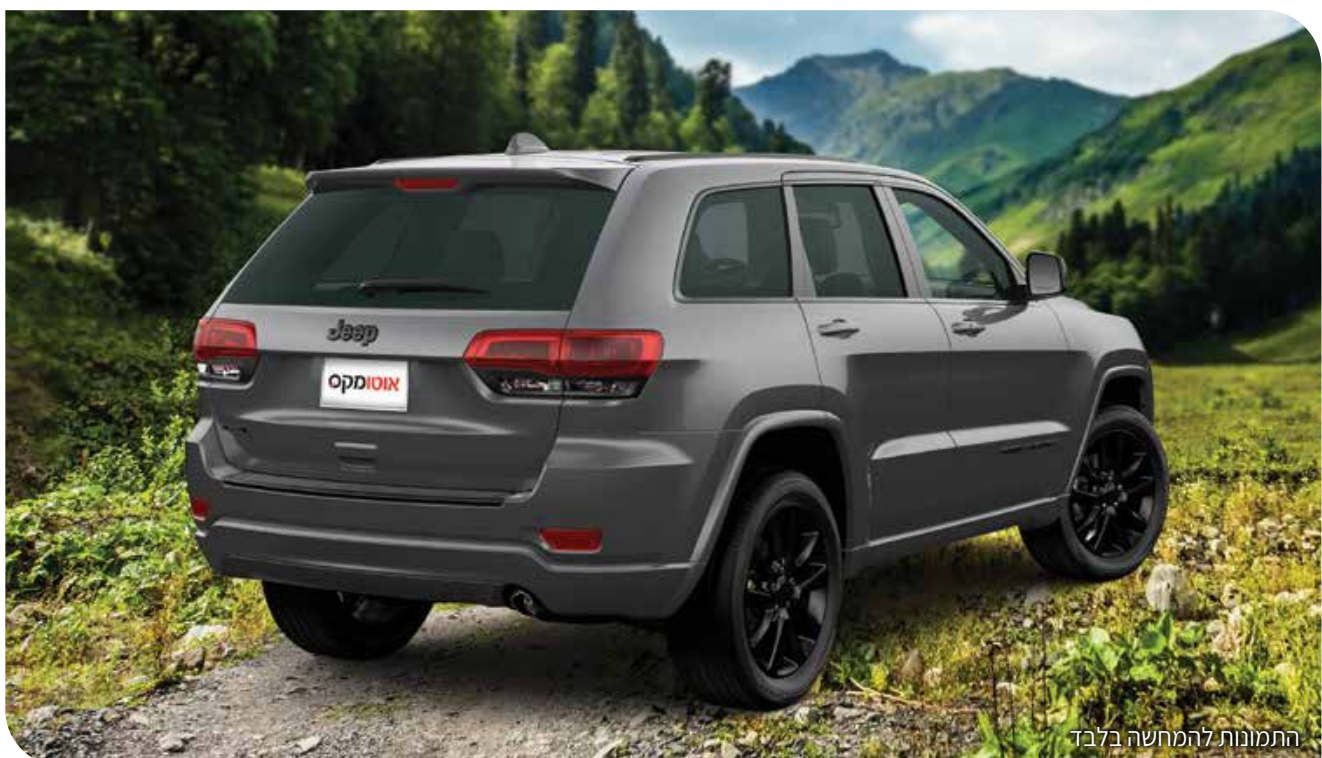
התמונות להמחשה בלבד