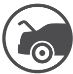
דלת תא מטען חשמלית

JEEP זה עוצמה ויכולת. הכוח-295 כוחות סוס, מגיע ממנוע פנטאסטאר V6 בנפח 3.6 ל' עם טכנולוגיית תזמון שסתומים משתנה. המנוע העוצמתי ביחד עם תיבת הילוכים בת 8 מהירויות מבטיחים זמינות כוח מדהימה ויכולת דינאמית מלהיבה בכל מצב נהיגה או עומס. חבילת הבטיחות המקיפה כוללת 7 כריות אוויר, עיגוני ISOFIX למושב בטיחות לילדים, מערכות בקרת משיכה ויציבות. מהמתקדמות שיש, 4 כוכבי בטיחות של NHTSA האמריקאית ובנוסף מערכת התראה מתקדמת למניעת תאונות מבית AWACS.