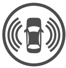
מערך בטיחות אקטיבית

בג'יפ מאמינים שבטיחות מעל לכל. מערך הבטיחות האקטיבית מבטיח אתכם בכל מצב. 7 כריות אוויר, בקרת שיוט אדפטיבית, בלימת חירום אוטונומית, בקרת סטייה מנתיב אקטיבית, זיהוי שטחים מתים במראות ועוד. כל מה שצריך כדי להפוך את הנסיעה להרפתקה בטוחה ונעימה, על הכביש או בשטח. כי להביא את המשפחה הביתה בשלום זה הכי חשוב.