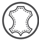
ריפודי עור נאפה