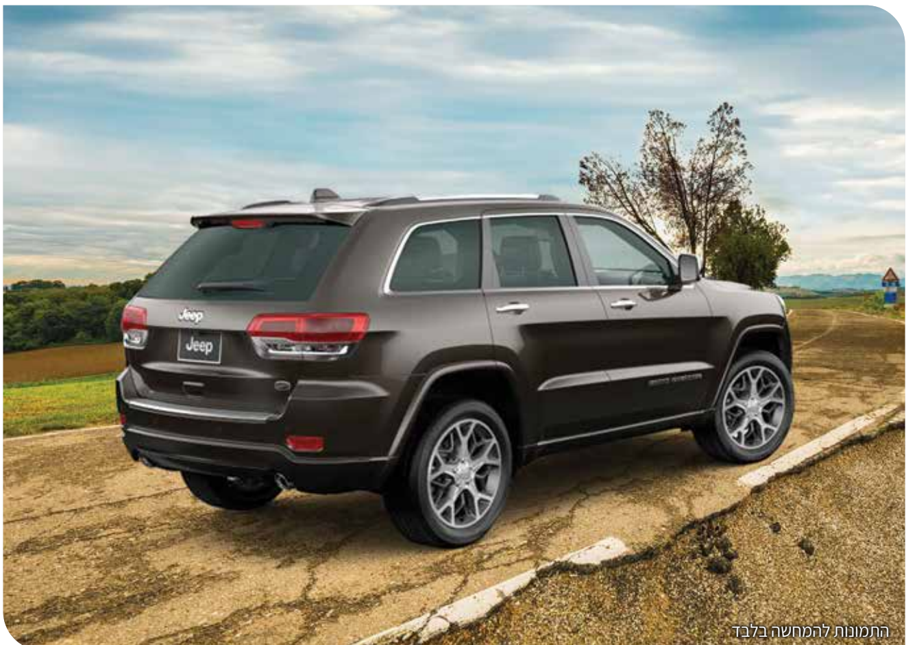
התמונות להמחשה בלבד