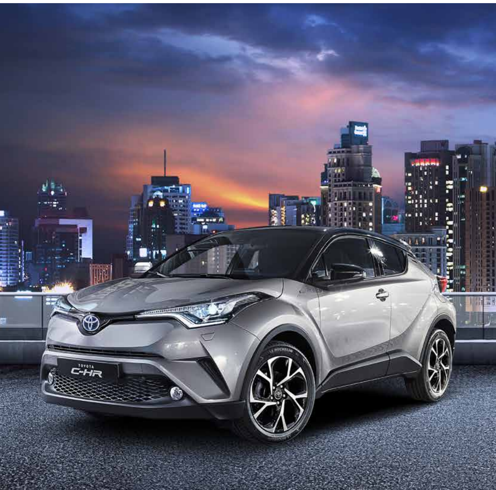
טויוטה C-HR Hybrid